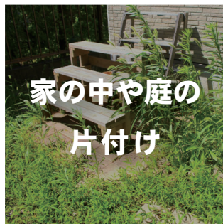
家の中や庭の 片付け