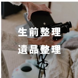
生前整理 遺品整理

山元建設は住宅の建設やリフォームを主に行っている会社です。そのノウハウを活かし、お家に関する困り事のご相談や土地や建物の売却まで、まとめてご依頼頂けます。ご相談内容に合わせて、専門パートナースタッフがご対応させて頂きます。